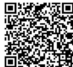
Smart Probes App